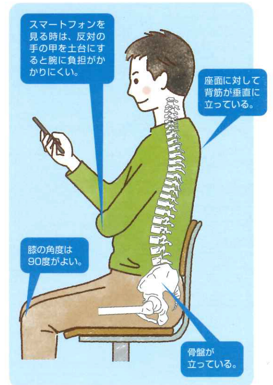
図2 良い姿勢(骨盤を立たせて座る) 背筋が自然なS字カーブを描き、重い頭をバランスよく支えている。