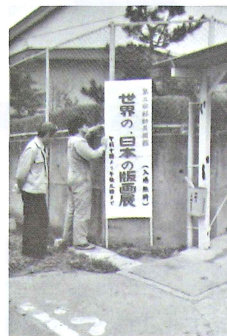
「移動美術館」の看板 (1985年)

〒970-8026 福島県いわき市平字堂根町4-4 TEL.0246-25-1111 FAX.0246-25-1115 URL: http://www.city.iwaki.lg.jp/artmuseum.html