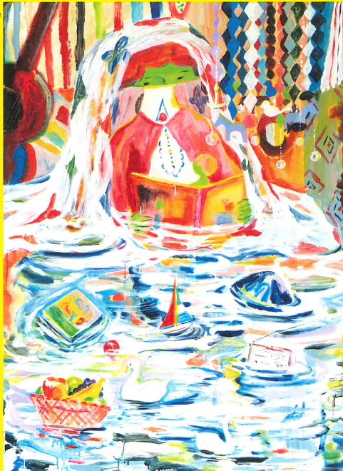
《名前の知らないわたしと誰かが聞いている》2023年

まさに旅をする時のように、先が見えない不安や恐れをも楽しみに変えてしまうような気持ちで活動の幅を広げてきた荒井良二。本展では、そんな荒井の「いままで」と「これから」を語る作品たちを、作家自身が選び再構成して紹介します。絵画や絵本原画、イラストレーション、そして新作となるインスタレーションや愛蔵の小物たちを通して、ここからまた誕生=new bornする荒井良二の世界をご体感ください。