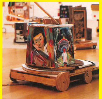
(new born 旅する名前のない家たちを ぼくたちは古いバケツを持って追いかけて 湧く水を汲み出す)より 2023年