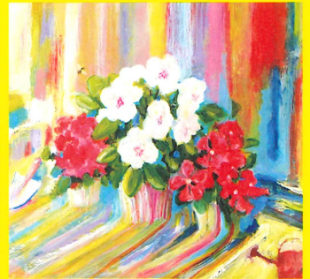
『あさになったのでまどをあけますよ』原画(表紙)2011年 偕成社